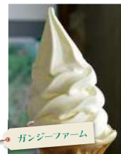
ガンジーファーム