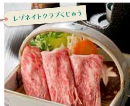
レゾネイトクラブピュウ